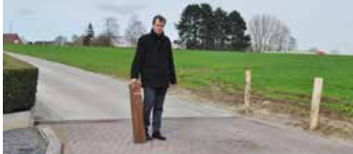
Oppositie loont p. 2 en 3