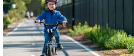
4,7 miljoen euro voor fietsinfrastructuur p. 2